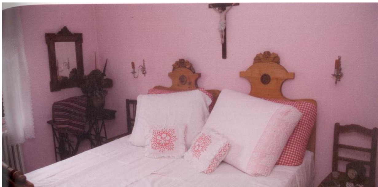
PRIMER AUTENTIČNE SOBE