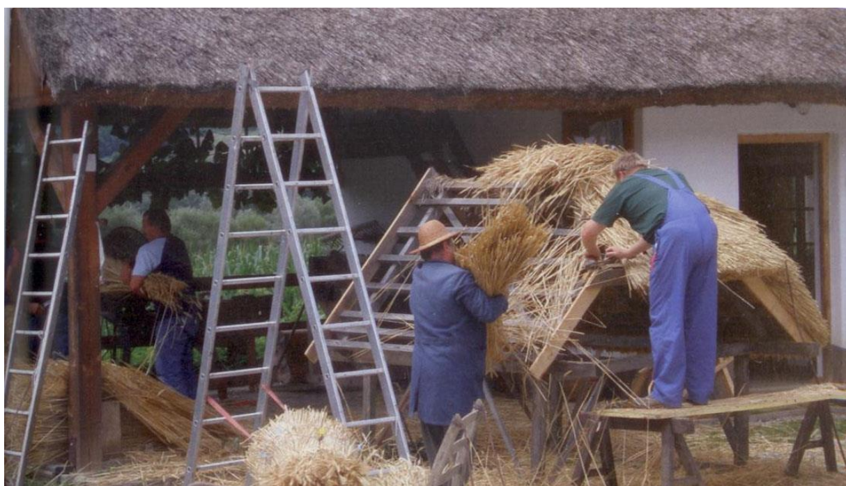
AUTENTIČNI REKREATIVNI SADRŽAJ